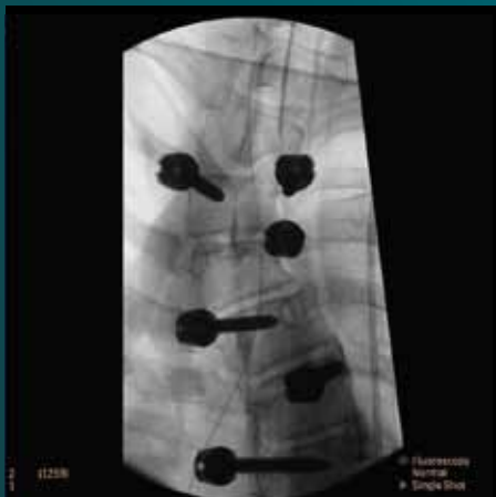
Грудной отдел позвоночника в передней проекции — комбинированное изображение для исследования сколиоза