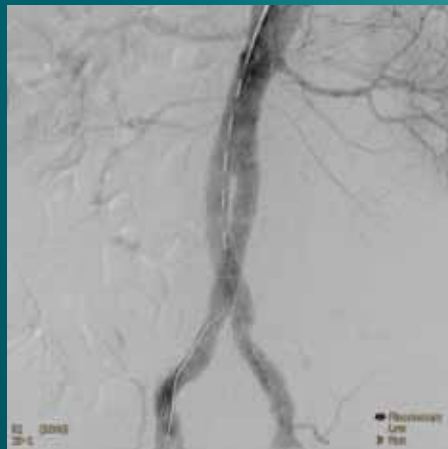
EVAR (EndoVascular Aneurysm Repair — внутрисосудистое лечение аневризмы)