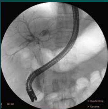
Эндоскопическая ретроградная холангиопанкреатография (ERCP) в передней проекции