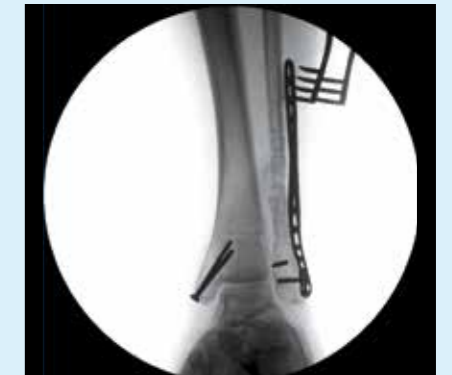
Перелом голени – система BV Endura обеспечивает отличное качество изображений даже без применения шторок, что упрощает рабочий процесс.