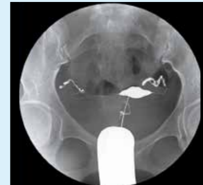
Гистеросальпингография – эти процедуры все чаще выполняются с использованием передвижных рентгенохирургических систем. Система BV Endura предлагает превосходное качество изображений для поддержки таких исследований.