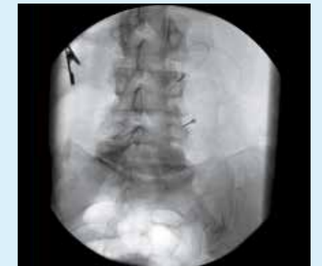
Процедура лечения болевого синдрома – система BV Endura позволяет врачам визуализировать введение иглы в области позвоночника.